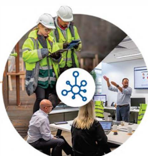
Flujos de trabajo conectados